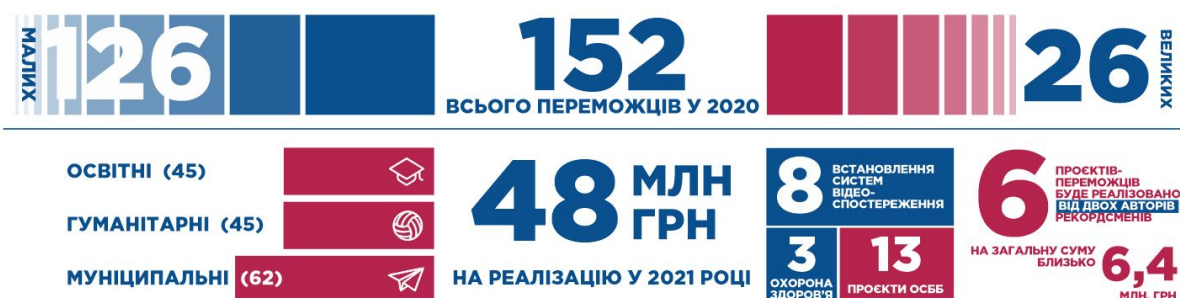
Рис. 2. Підсумки V етапу бюджету участі Дніпра (2020-й рік)

Серед проектів-переможців 26 великих (8 освітніх, 8 гуманітарних та 10 муніципальних), та 126 малих (37 освітніх, 37 гуманітарних та 52 муніципальних). Серед переможців 3 проекти стосуються покращень у медичній галузі, 8 - встановлення систем відеоспостереження. 13 проектів у 2021 році буде реалізовано в ОСББ.