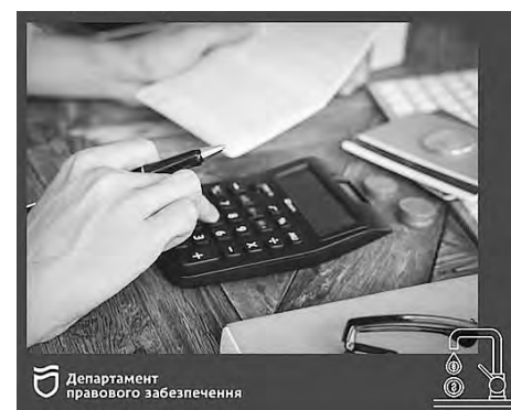
Департамент правового забезпечення

• Утримання будинку та прибудинкової території зазвичай не скасовується – ці витрати регулюються статутом ОСББ або договором із керуючою компанією.