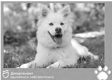
Департамент правового забезпечення

В Україні вперше затверджено єдині та оновлені правила перевезення домашніх тварин у міжміських та міжнародних автобусах, а також у всіх типах залізничного транспорту. Нововведення покликані забезпечити комфортну подорож для пасажирів і їхніх улюбленців, а також встановити чіткі вимоги до дій перевізників і пасажирів.