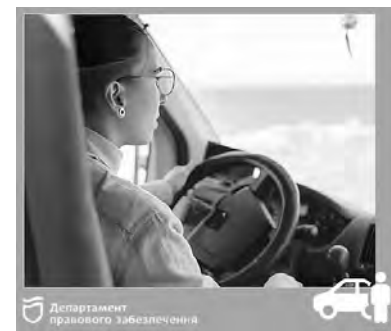
Департамент правового забезпечення