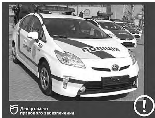
Департамент правового забезпечення

Скарга подається до слідчого судді суду першої інстанції, у межах територіальної