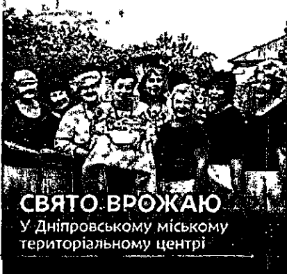
СВЯТО ВРОЖАЮ У Дніпровському міському територіальному центрі

— Сьогодні ми всі потребуємо такого тепло, атмосферного, родинного свята. Дякуємо всім хто прийшов, дякую нашим невтомним