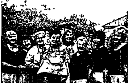
СВЯТО ВРОЖАЮ У Дніпровському міському територіальному центрі

Осінь з давніх-давен вважається порою спокою і відпочинку після періоду живих і роботи в полі. Це час збору врожаю, на честь якого ще у наших предків-слов'ян влаштовувалися свята і гуляння, просякнуті подякою родючій землі. Навіть зараз у сучасності добрий врожай є базисом добробуту країни. Тому продовжуємо традицію вересневих святкувань разом із Дніпровським міським територіальним центром!