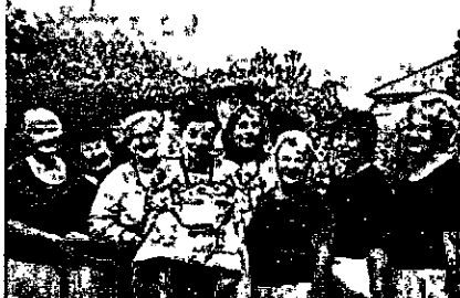
СВЯТО ВРОЖАЮ У Дніпровському міському територіальному центрі

Осінь з давніх-давен вважається порою спокою і відпочинку після періоду живих і роботи в полі. Це час збору врожаю, на честь якого ще у наших предків-слов'ян влаштовувалися свята і гуляння, просякнуті подякою родючій землі. Навіть зараз у сучасності добрий врожай є базисом добробуту країни. Тому продовжуємо традицію вересневих святкувань разом із Дніпровським міським територіальним центром!