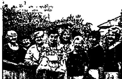
СВЯТО ВРОЖАЮ У Дніпровському міському територіальному центрі

— Сьогодні ми всі потребуємо такого тепло-го, атмосферного, родинного свята. Дякую всім хто прийшов, дякую нашим невтомним